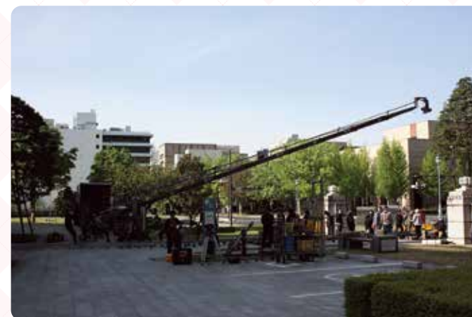
▼昭和館4階の正庁を外から撮影するために巨大なクレーンが活躍しました。

出演：細田佳央太 山田孝之 ほか 原作：岩明均「七夕の国」(小学館刊) 監督：瀧悠輔、佐野隆英、川井隼人 ©2024 岩明均/小学館/東映