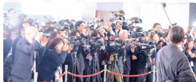
▲偉人内閣の面々が大階段に登場すると、ロビーはどよめきに包まれました。その反応を見た武内監督からは『本番も今のリアクションをお願いします(笑)』との指示が。