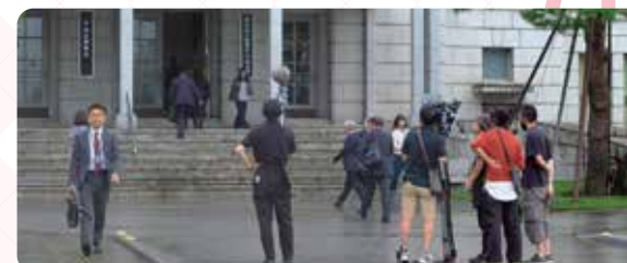
▲主人公の奏(石原さとみ)が働く横浜地検中央支部という設定で撮影が行われました。

脚本：吉田紀子 監督：新城毅彦 星野和成 中村圭良 出演：石原さとみ 亀梨和也 ほか 『Destiny』Blu-ray&DVD発売中! Blu-ray 32,340円(税抜29,400円) 4枚組 DVD 26,400円(税抜24,000円) 6枚組 【発売元】 株式会社テレビ朝日 【販売元】 TCエンタテインメント株式会社 ©tv asahi All rights reserved.