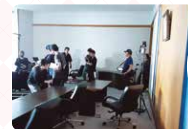
▲会議室のテーブルや椅子は元々置かれていたものをそのまま使用しました。窓から差し込む青白い光は、外側からライトを当てて演出しています。