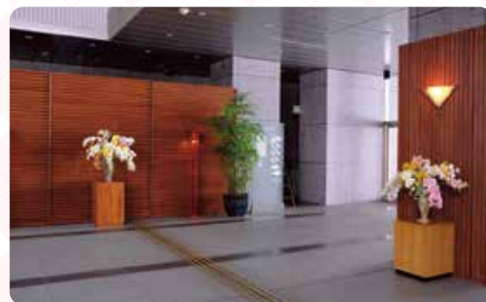
▲官邸の雰囲気により近くなるよう、柱などに装飾が施されました。