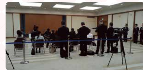
▲記者会見シーンの記者役はエキストラの方にご協力いただきました。