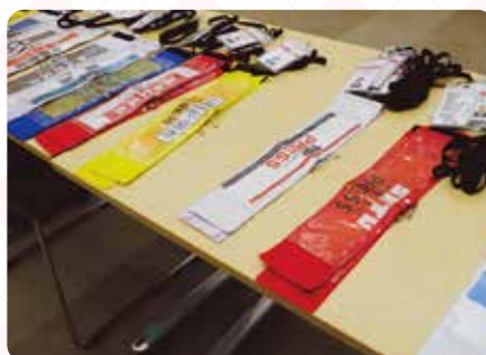
▲記者役エキストラの撮影小道具